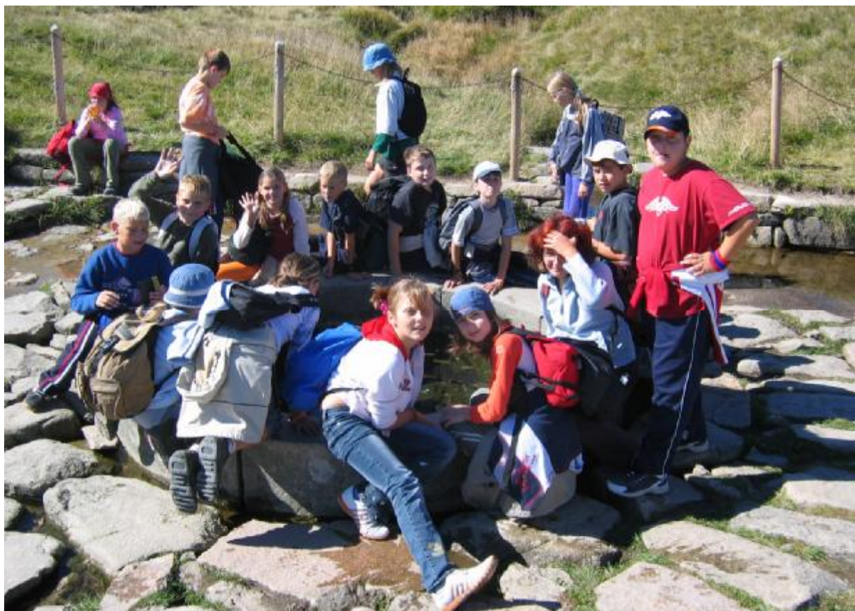
„Spolu to dokážeme“ - třída VI. A u pramene Labe